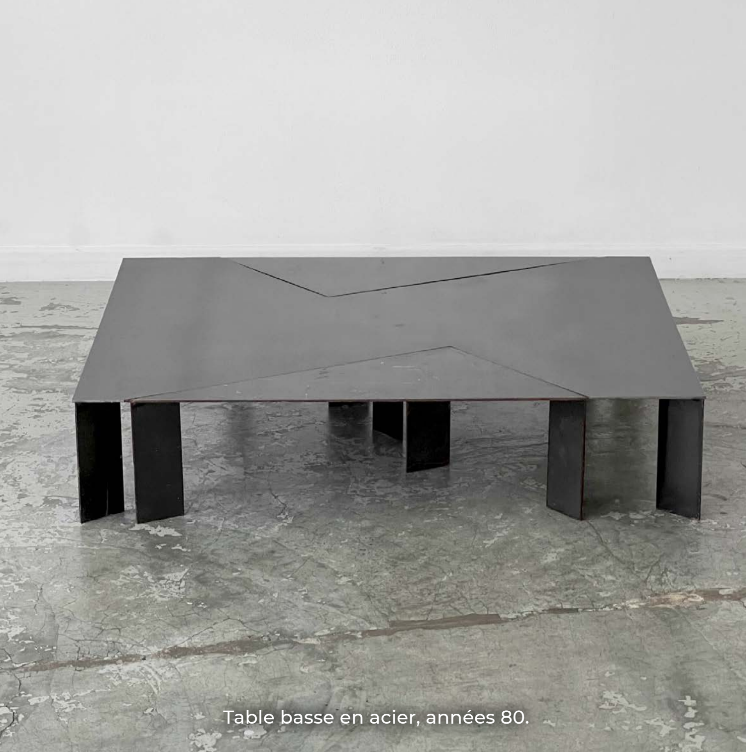
Table basse en acier, années 80.