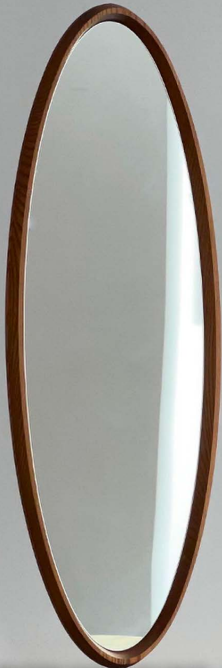
Miroir de forme ovale en teck, années 70.