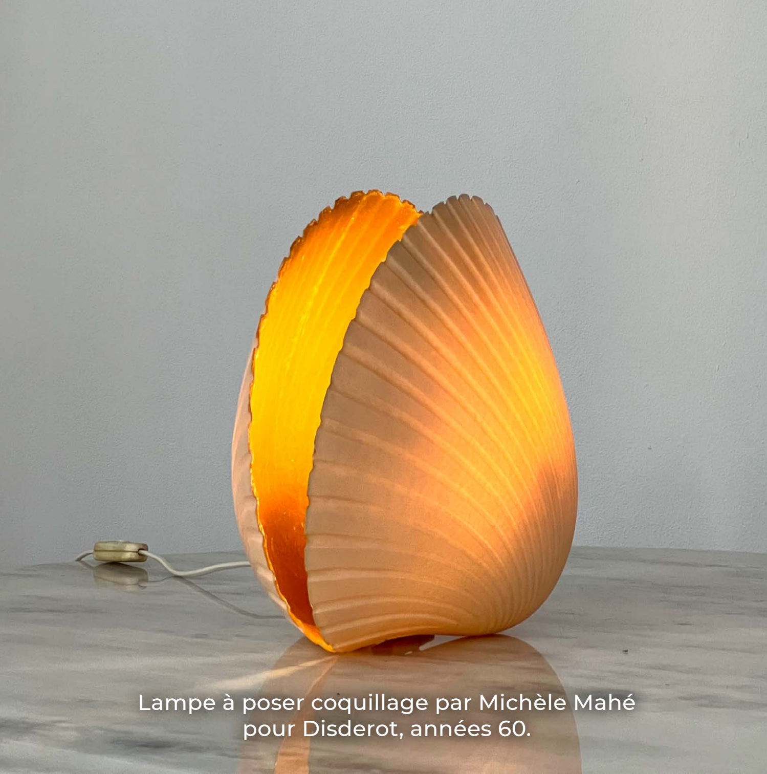
Lampe à poser coquillage par Michèle Mahé pour Disderot, années 60.