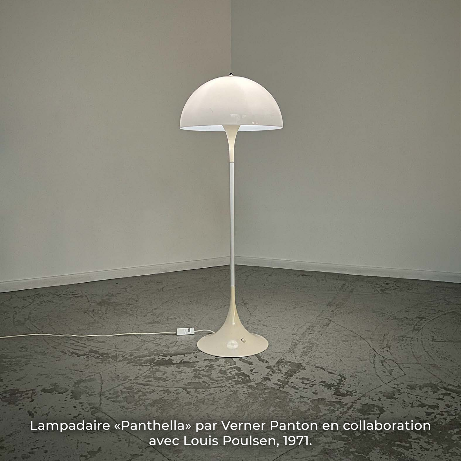
Lampadaire «Panthella» par Verner Panton en collaboration avec Louis Poulsen, 1971.