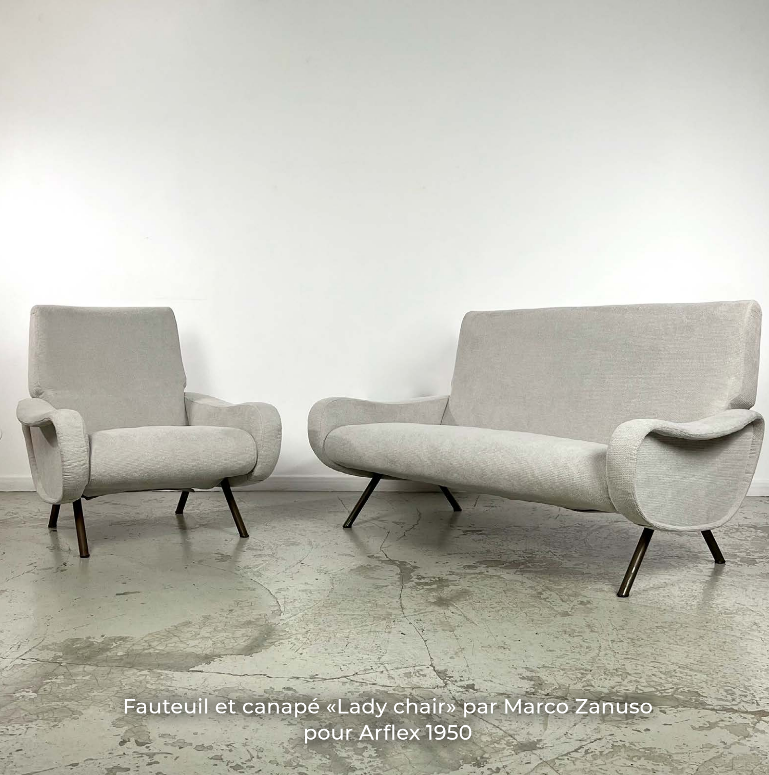
Fauteuil et canapé «Lady chair» par Marco Zanuso pour Arflex 1950