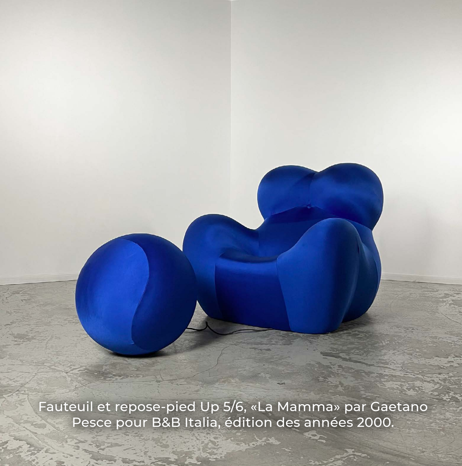
Fauteuil et repose-pied Up 5/6, «La Mamma» par Gaetano Pesce pour B&B Italia, édition des années 2000.