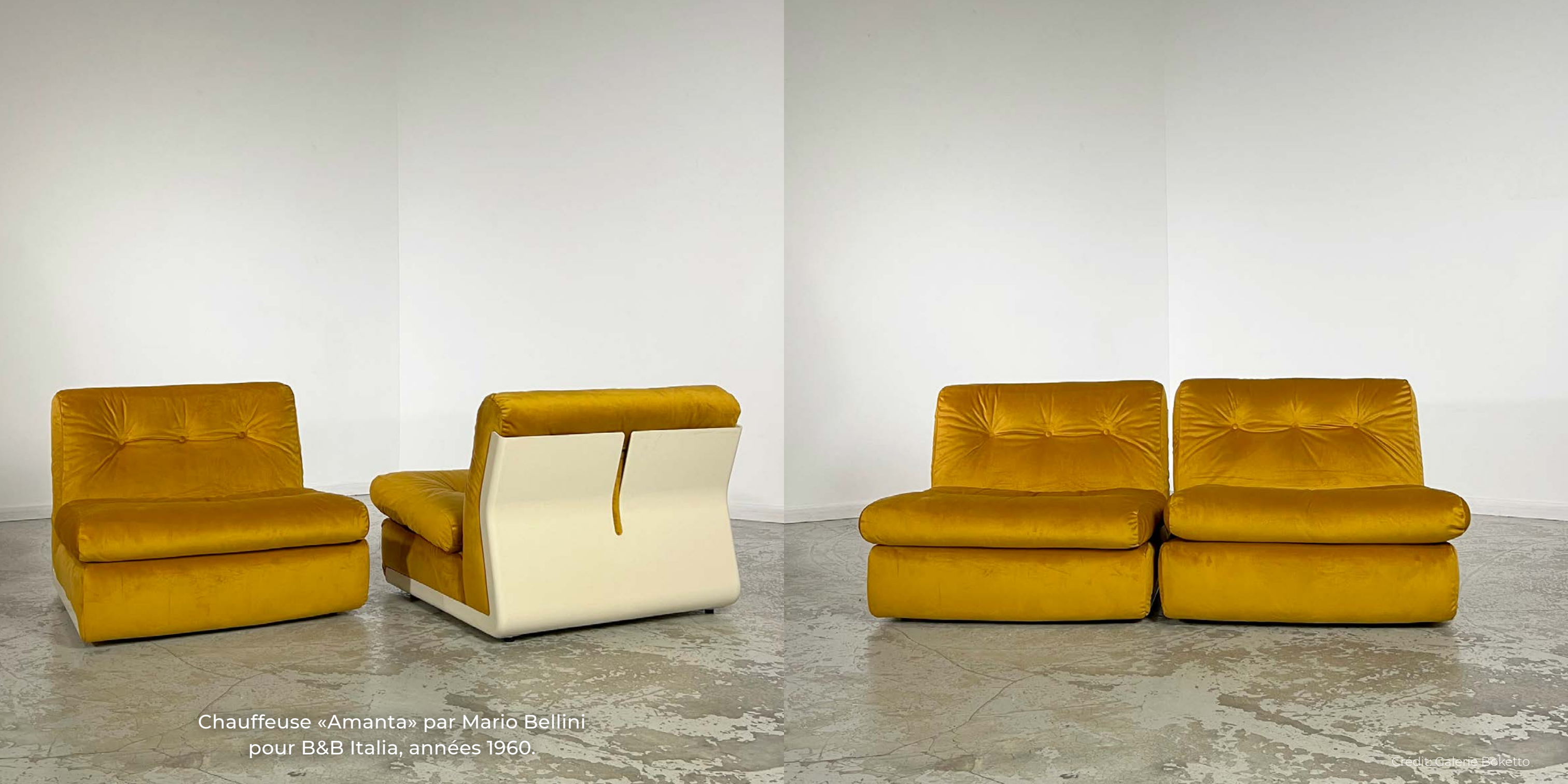
Chauffeuse «Amanta» par Mario Bellini pour B&B Italia, années 1960.