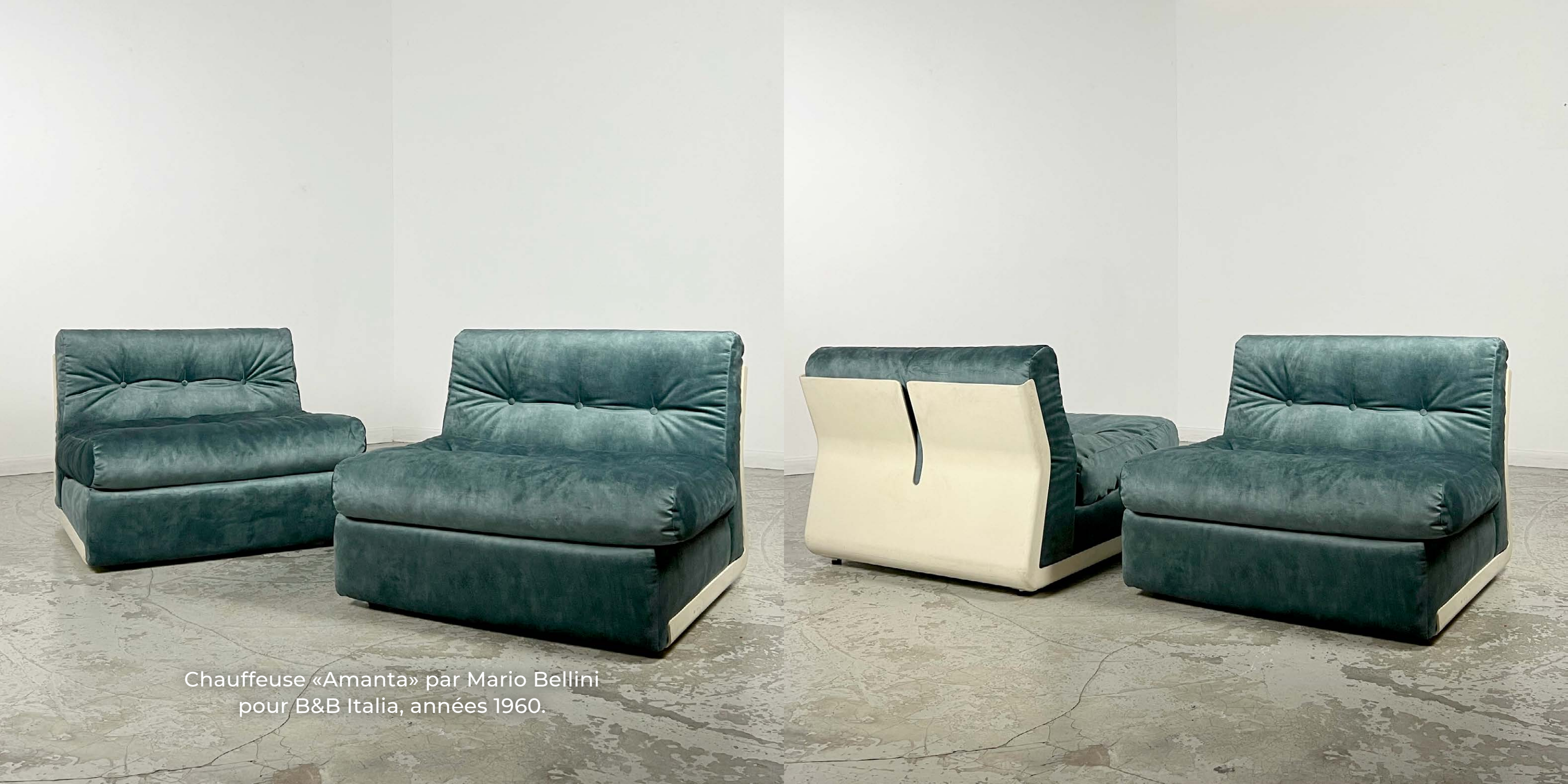
Chauffeuse «Amanta» par Mario Bellini pour B&B Italia, années 1960.